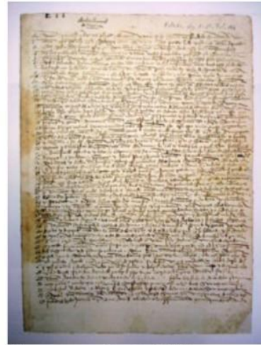
El manuscrito de 1493, conservado en el Archivo General de Simancas.

A la primera que yo hallé puse nombre San Salvador a conmemoración de Su Alta Majestad, el cual maravillosamente todo esto ha dado; los Indios la llaman Guanahaní; a la segunda puse nombre la isla de Santa María de Concepción; a la tercera Fernandina; a la cuarta la Isabela; a la quinta la isla Juana [3] , y así a cada una nombre nuevo.